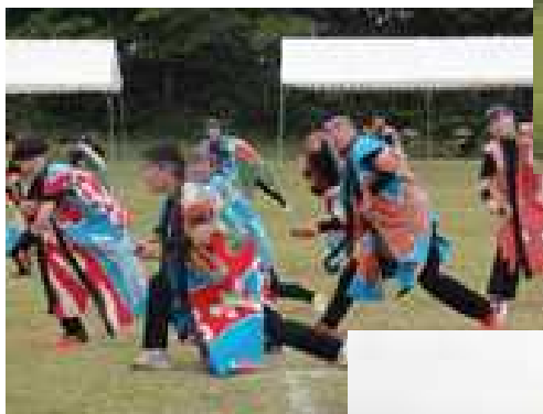
【二中伝統 よさこいソーラン】