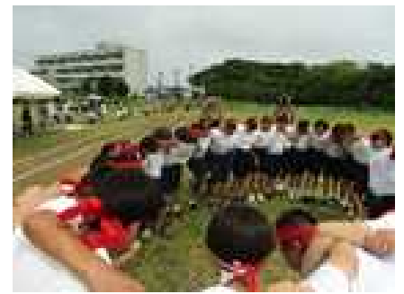
【紅組 勝利に向けて】