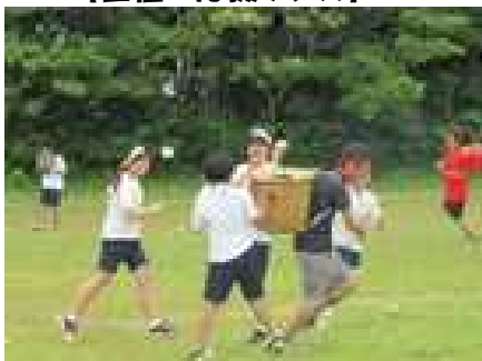
【本気でやると 本気で悔しい】 【勝敗を超えたところに 本当の感動が】