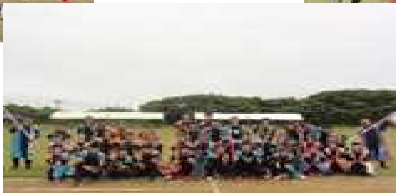
【令和5年度 運動会 マスク越しでは伝わらない たくさんの笑顔がそこにあった 感動をありがとう！】