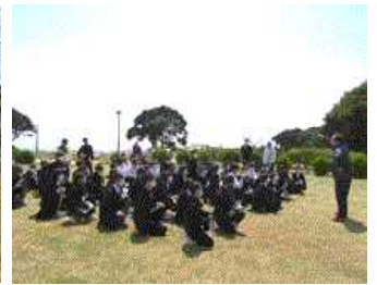
【約13分で高台への避難が完了】