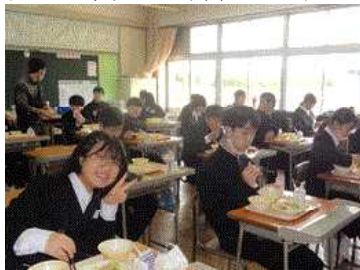
【給食が始まりました

新入生22名を代表した誓いの言葉の中で、 さんが、中学生になって頑張りたいこととして①「勉強」授業への集中と毎日の家庭学習を頑張る②「部活動」自分の好きなことで仲間や先輩と切磋琢磨していく③「人とのふれあい」関わりをとおして、中学生らしい態度や言葉を身に付けたいと3つの決意を挙げました。入学式にご臨席をいただいた来賓と保護者の皆様には、改めて御礼と感謝を申し上げます。