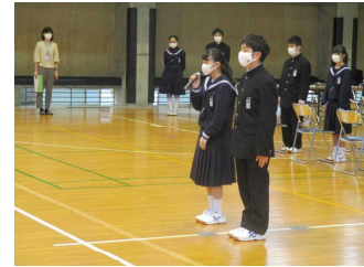
新入生からお礼の言葉