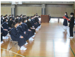
生徒会本部役員の説明

4月14日（金）「新入生歓迎会」を実施しました。生徒会本部役員による銚子一中の生活や行事の説明、各部活動の紹介を行いました。先輩方の発表を真剣に見て、話をしっかりと聞く1年生の姿に、中学校生活への意気込みを感じました。これから共に活動していくのがとても楽しみです。銚子一中の一員として、自分たちの手でよりよい学校生活を創り上げていきましょう。