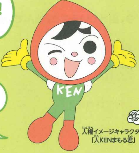
人権イメージキャラクター 「人KENまもる君」