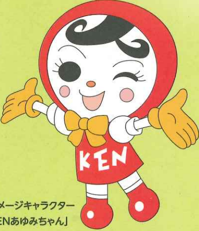
人権イメージキャラクター 「人KENあゆみちゃん」