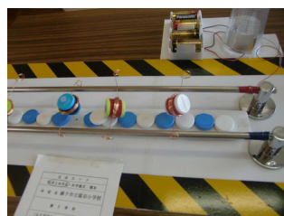
真修君「ブルブルレース」