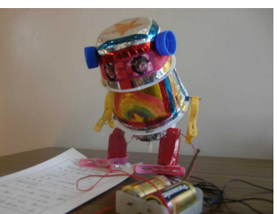
恵里さん「速く回るキャップ」