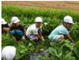
【1・2年生サツマイモ】