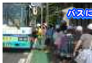
バスに乗って出発!