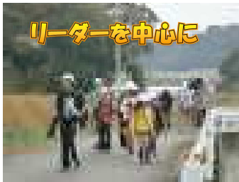
リーダーを中心に

飯岡灯台では、リーダー中心に水分補給をして、おやつを食べ、休憩を取り、元気を取り戻して、ゴールのみなと公園を目指しました。