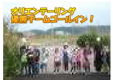
オリエンテーリング 優勝チームゴールイン!