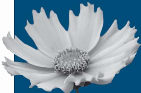
▲オオキンケイギク

根元から引き抜き、ビニール袋に入れて枯死するまで数日間放置します。枯死したら普通ごみへ。