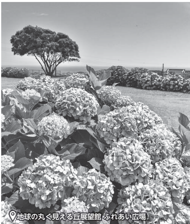
地球の丸く見える丘展望館 ふれあい広場