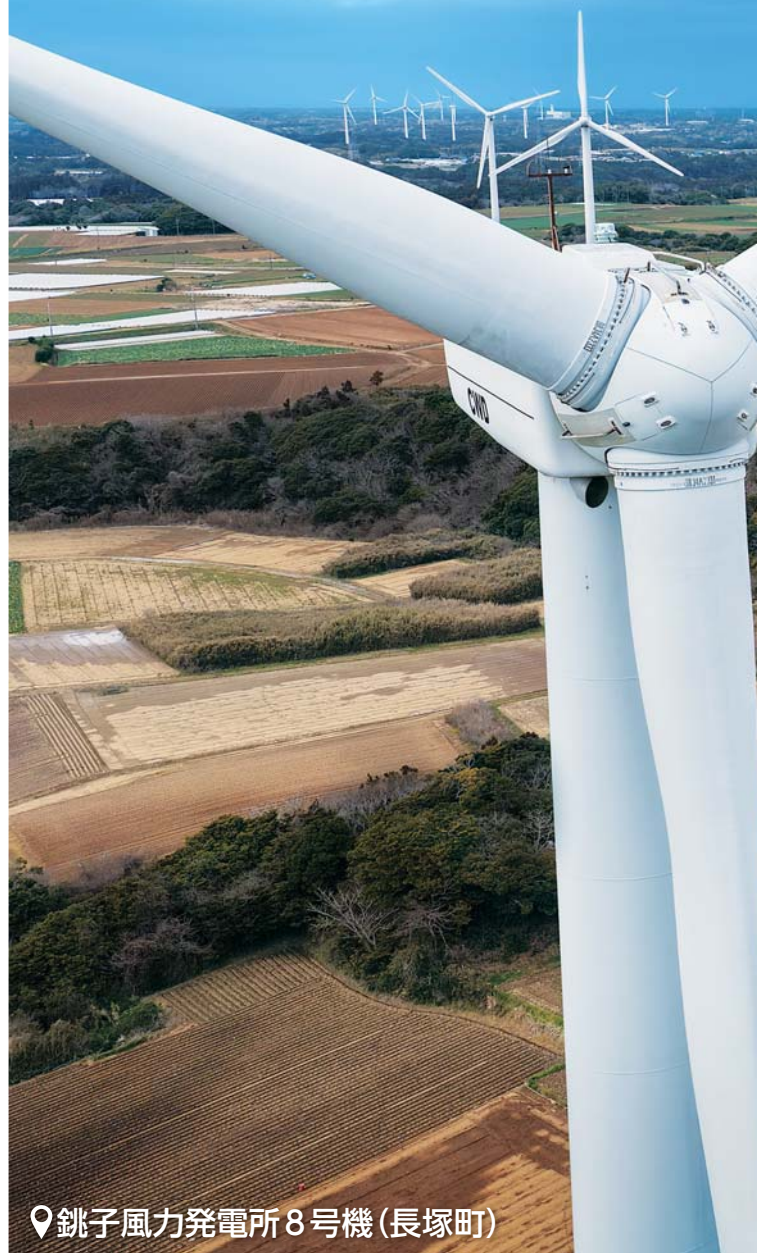
📍銚子風力発電所8号機(長塚町)

＼災害救助で活躍／ 銚子市消防本部のドローンで撮影 訓練を兼ね、日々技術を磨いています