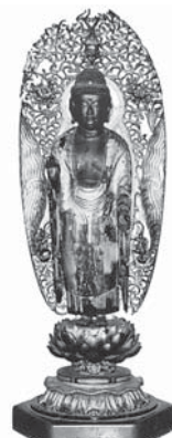
木造阿弥陀如来立像