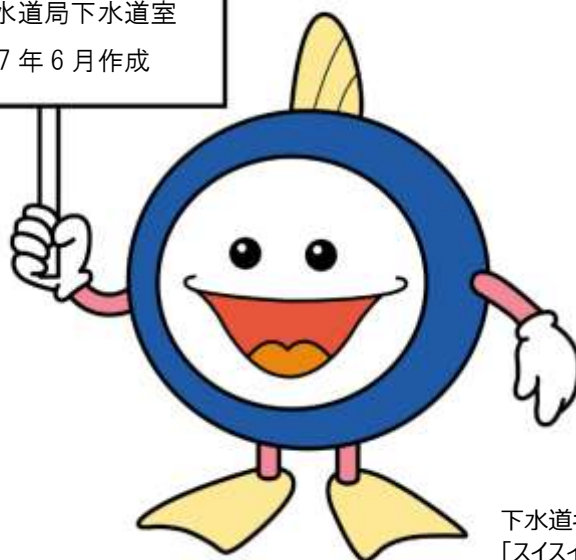
下水道キャラクター 「スイスイ」