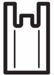
金属類のごみ (資源ごみ袋)