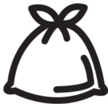
有害ごみ (透明か半透明の袋)