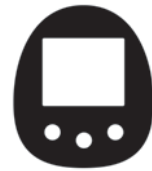
本体 (取り外せるとき)