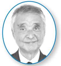
市民クラブ 鎌倉 金