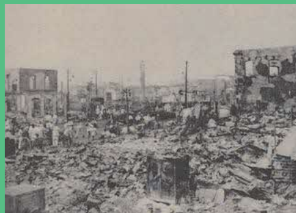
現銀座四丁目交差点付近の焼跡