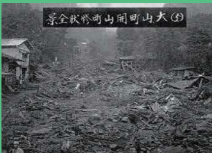
神奈川県中郡大山町(現伊勢原市内)で9月15日に発生した土石流災害

また、発生時刻(11時58分)が昼食の時間と重なったことから、多くの火災が発生し、大規模な延焼火災に拡大しました。関東大震災により全半潰・消失・流出・埋没の被害を受けた住家は総計約37万棟のぼり、死者・行方不明者は約10万5000人に及びました。