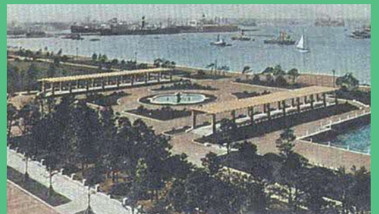
横浜市の山下公園(震災時の瓦礫を埋め立てて造られた)

災害救護に当たっては、現代で言うボランティアとも言うべき住民同士の助け合いや、海外を含む遠隔地からの支援が大きな役割を果たしたことが知られています。