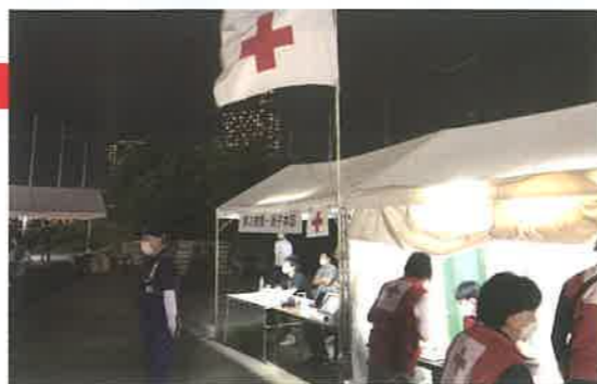
奉仕団が花火大会で臨時救護を行いました