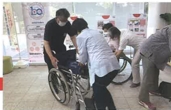
奉仕団員が車いすの指導方法を学びました