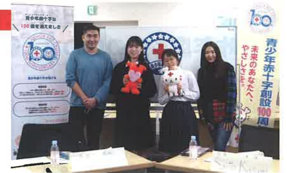
海外青少年赤十字メンバーと交流しました