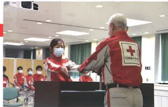
医療救護班の任命をしました

青少年赤十字指導者協議会役員会・総会 防災ボランティア推進協議会 地区・区分新任事務委員研修会