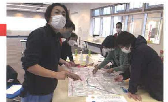
防災教育の指導者の知識の向上を図りました