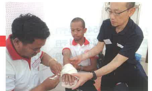
ラオスにおける救急法普及のため職員を派遣しました