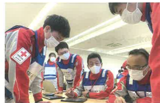
埼玉県が被災した想定で災害対策本部の訓練を行いました