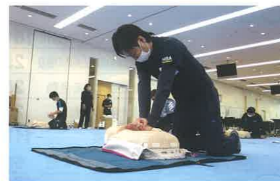
新たに10名の救急法指導員を養成しました