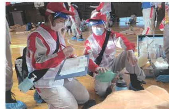
関東圏の日赤支部と合同で医療救護訓練を行いました