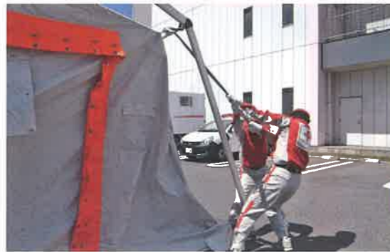
救護所用テントの設営訓練を行いました