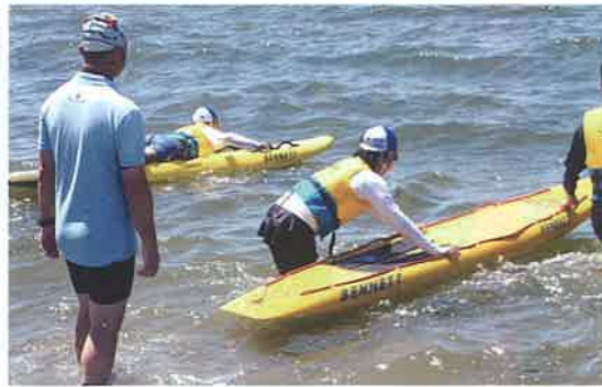
子ども達にライフセービングの体験の場を設けました