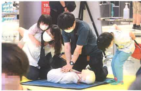
商業施設で救命体験イベントを開催しました