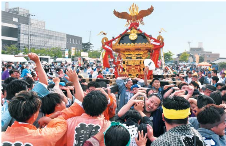
▲「よーいよいよやせー!」「おーりゃーどした!」 祭囃子と掛け声に自然と心躍る。銚子の夏は今が全盛