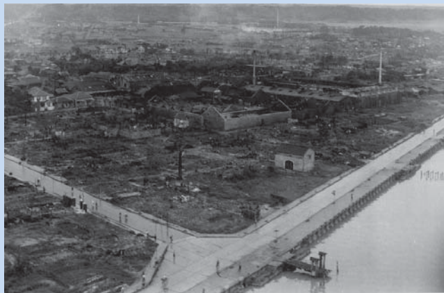
▲河岸公園交差点付近