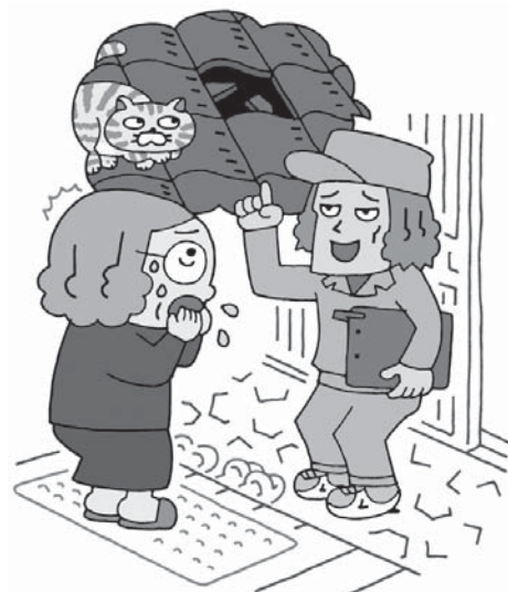
イラスト：黒崎 玄