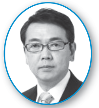
公明党 桜井 隆