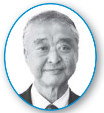
市民クラブ 鎌倉 金

答 事業者が金融機関から運転資金や設備投資の資金を調達する際、制度融資を設け、利子補給を行っています。また、商工会議所、金融機関などと連携し、創業支援、後継者育成、事業承継支援に取り組んでいます。今年度は、物価高騰対策として国のコロナ関係交付金を活用し、市内事業者に向けた1事業者当たり5万円の支援金の交付を行いました。