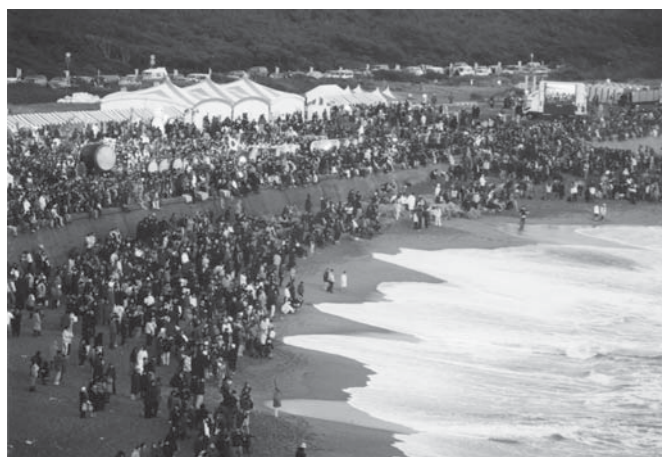
▲君ヶ浜 ミレニアムイベント。2000年を迎える(平成11~12年)