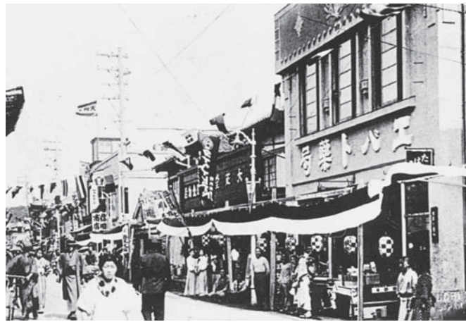
▲市制施行記念で賑わう和田町通り(昭和8年)