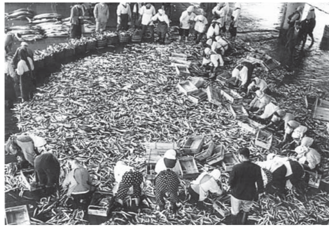
▲銚子漁港 大漁のサンマを選別する人々(昭和30年ころ)