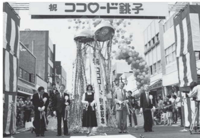
▲ココロードが完成(平成4年)