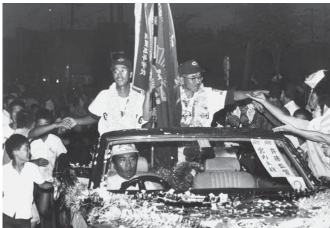
▲銚子商業夏の甲子園優勝パレード(昭和49年)