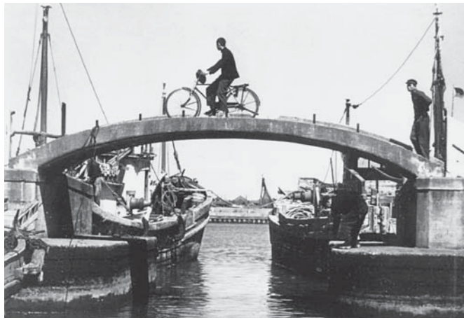
▲新生ドックのタイコ橋(昭和33~34年ころ)