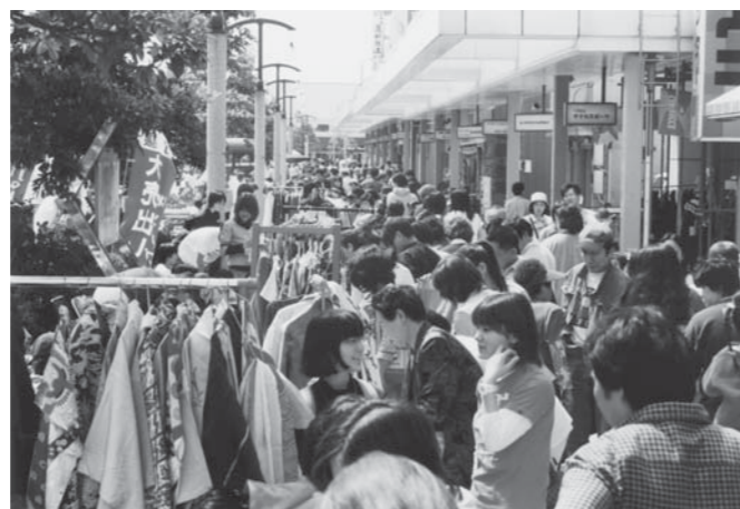
▲銚子駅前フリーマーケット(平成14年)