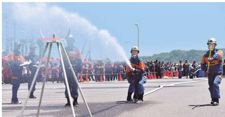
▲団員が技術を競う 消防操法大会

土のう設置、避難の呼びかけ、消火・排水作業や救助活動、捜索や土砂の撤去など多岐にわたる。