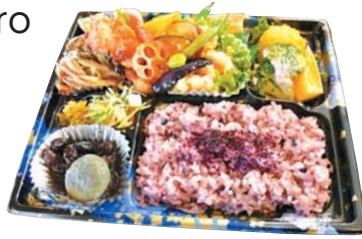
▲身体に優しい「まごごろ弁当」