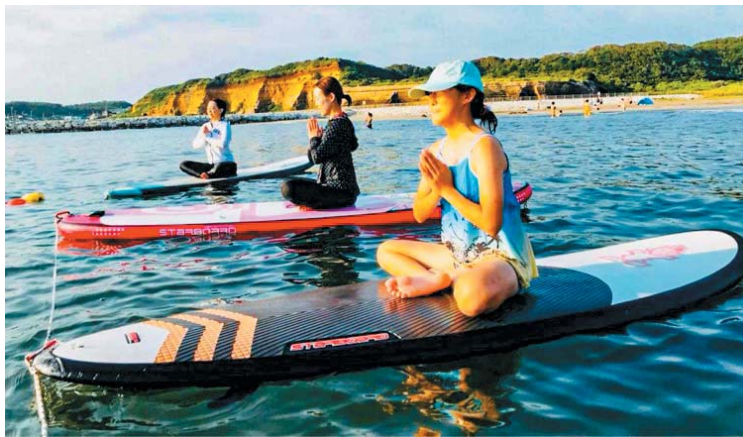
▲SUP(スタンドアップパドルボード)の上で行うヨガ 海と屏風ヶ浦をフルで味わう、銚子ならではの体幹トレーニング ドボン!!と海に落ちるのも一興(すぐに助けてくれます)