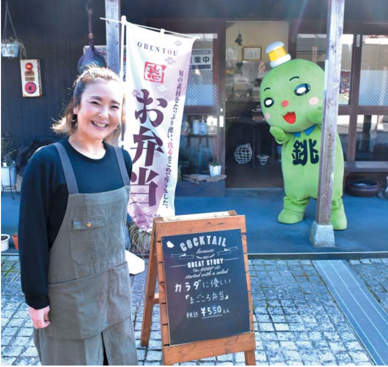
▲2020年9月にオープンした当日の手作りにこだわのお弁当屋さん ジャパンチャレンジャーアワード2022 in 銚子 >>>