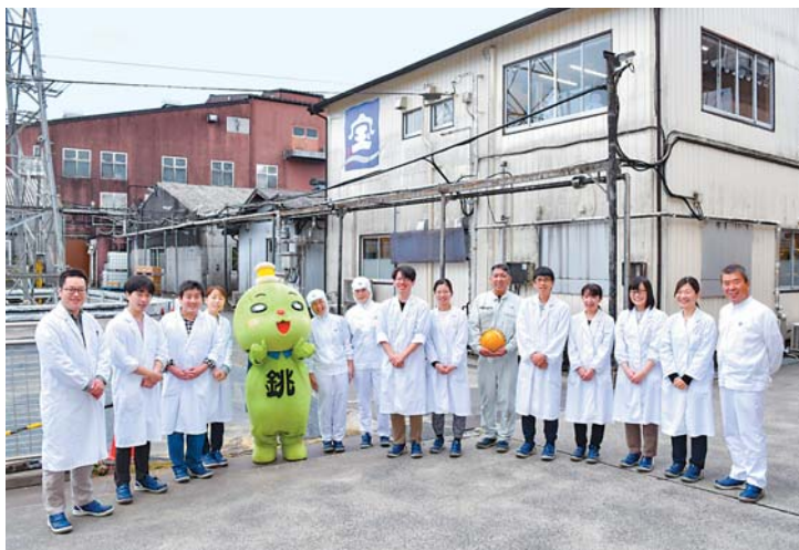
▲モットーは「社員が宝」 宝醤油のマークは「宝船」をイメージ