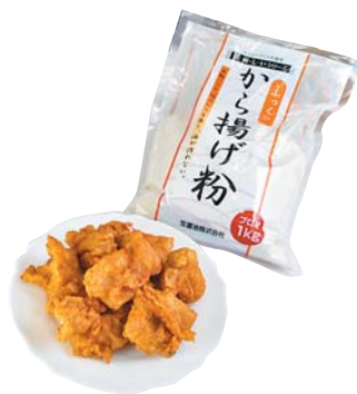
▲揚げたても冷めても美味しい唐揚げ