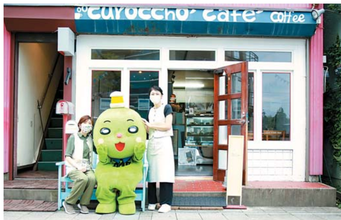
▲白が基調の可愛い外観。入りやすくて居心地が良い