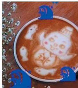
▲可愛いラテアート パリスタの全国大会で入賞 全国にパリスタ仲間ができた