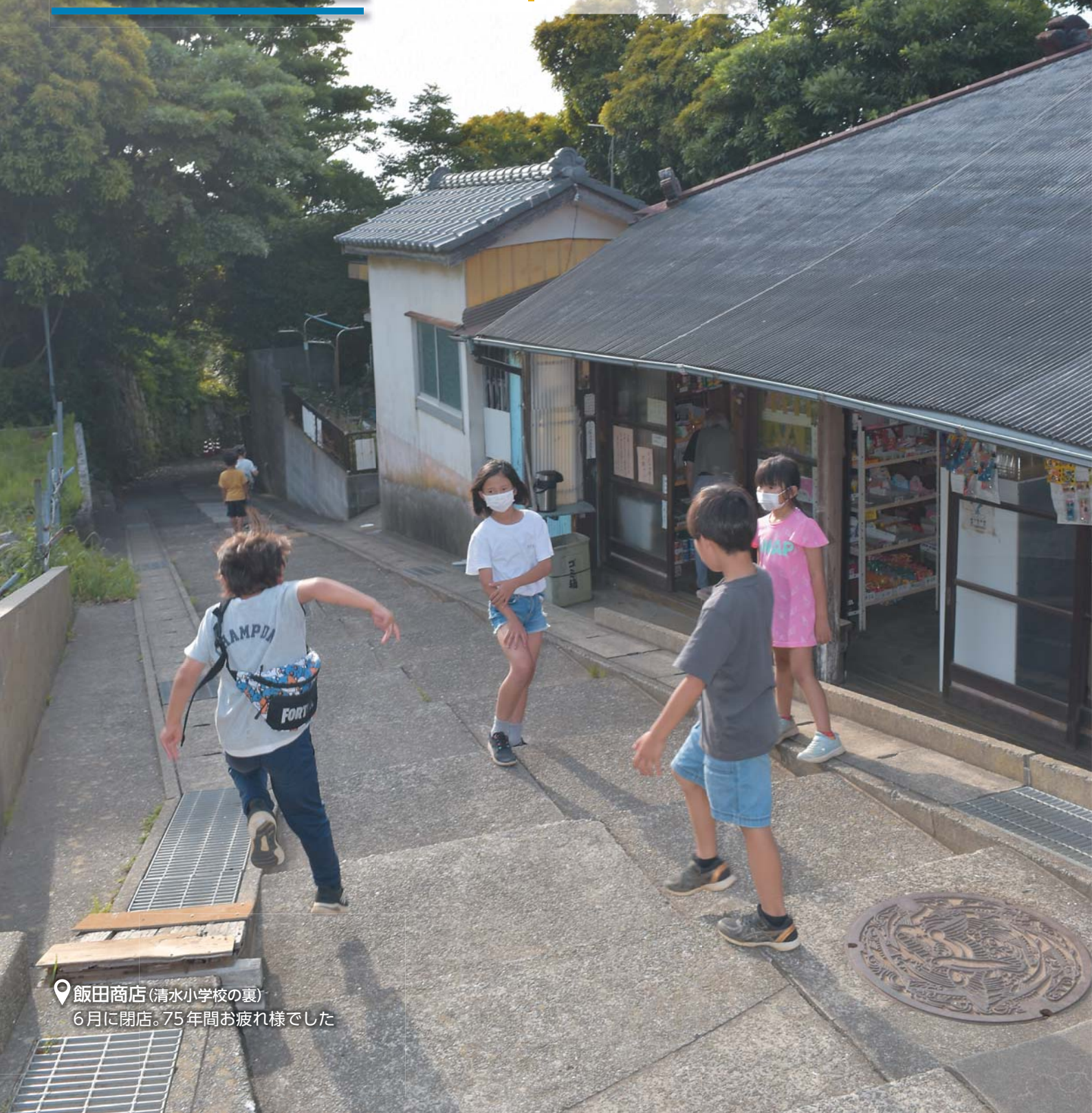
飯田商店(清水小学校の裏) 6月に閉店。75年間お疲れ様でした