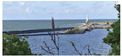
千人塚 1614年(慶長19)銚子沖で溺死した多くの人を弔った塚。かつて川口は狭く、船の出入りが困難で日本の三大難所の1つに数えられていた