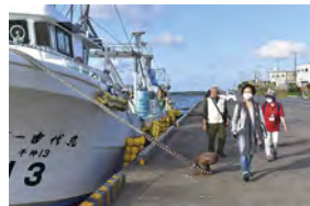
銚子漁港 目線の高さでカモメとすれ違って感激