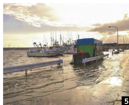
①利根川の水が水路に逆流し浸水発生(森戸町) ②車が水につかった(松岸町) ③忍町青年館も浸水 ④立ち往生する車(長塚町) ⑤道路にも水が上がってきた(本城ドック) ⑥水が引いて残ったゴミ(本城ドック) ⑦水位は膝下15cmほどか(松岸町) ⑧片づけをする人たち(唐子町)