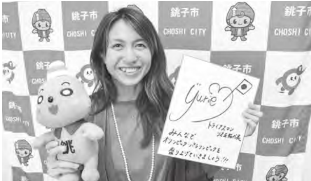
▲リオ五輪トライアスロン出場加藤選手直筆メッセージも展示中

銚子市にゆかりのあるオリンピック・パラリンピック選手、山口東一さん、加藤友里恵さん、渡邊紫帆さんの写真やユニフォームを展示しています。