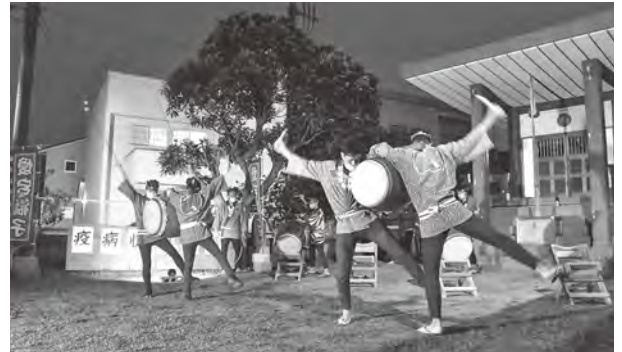
▲銚子ばやし保存会愛宕獅子はメンバー15人が「銚子大漁節」など6曲を演奏。勇壮なね太鼓も披露しました。

8月8日(土)の夜7時、市内12か所でおはやしが一斉に演奏されました。今年は祭の中止が相次いでいることから、市民に少しでも祭の雰囲気を感じてもらおうと銚子神輿連合会が企画。各演奏場所は事前に知らされませんでした。音色を聞きつけた近所の人が集まって、コロナ禍の束の間、「銚子の夏」を楽しんでいました。