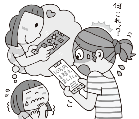
イラスト：黒崎 玄