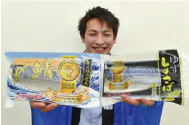
▲骨取り魚以外で人気なのは水産加工品初モンドセレクション金賞受賞の「メ鯖」(左)とゆずしめさば。定番の塩さばも人気