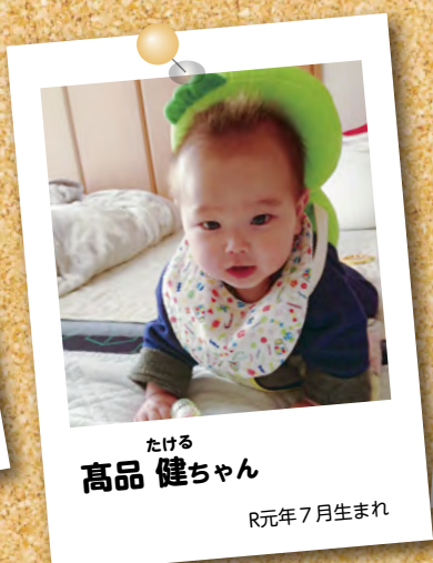
たける 高品 健ちゃん R元年7月生まれ