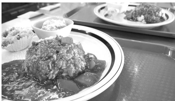
メニューは銚子野菜たっぷりカレー

あたたかいご飯で多世代間の出会いの場づくりを目指す「農家のお嫁ちゃん」たちによる1日限定の食堂です。新鮮野菜直売や絵本読み聞かせワークショップも開催します。