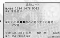
通知カードや住民票