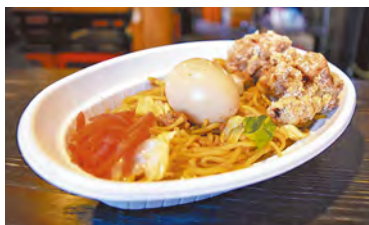
▲親子焼きそば。12月からはお店でも食べられます。