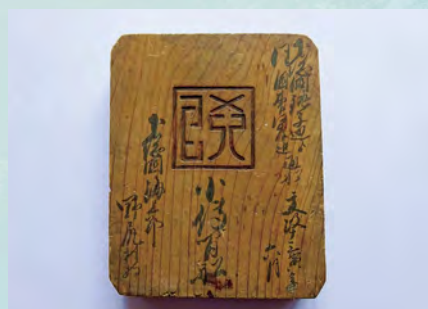
▲文政13年(1830) 発行の船の所有権を証明する船鑑札