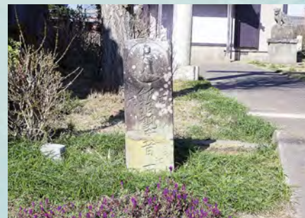
▲「飯沼観世音江一里」の道標(長塚町)

そして、佐倉道は成田から佐原まで延び、佐原で木下河岸から飯沼村へ続く「銚子道」につながります。