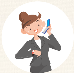
保育施設の時間外や、学校の放課後などに子どもを預かる