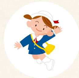
保育施設への送り迎え