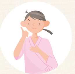
保護者の病気や冠婚葬祭などの急用時に子どもを預かる