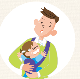
病児・病後児の預かりや早朝・夜間などの緊急時に預かる(一部地域で実施中)