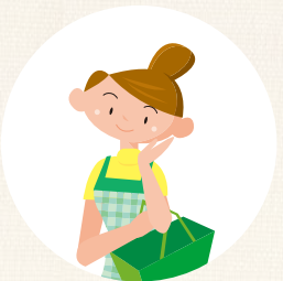
保護者が買い物など外出の際、子どもを預かる