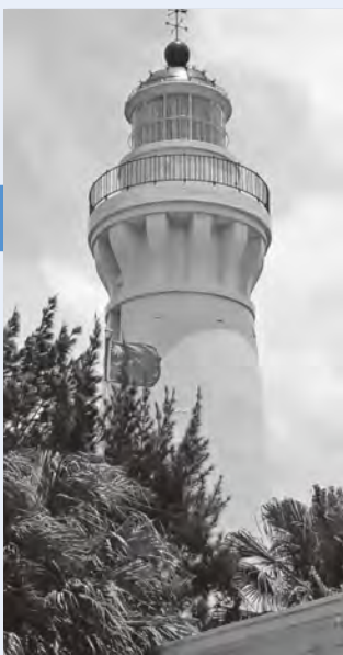
▲白沙岬灯台（台湾桃園市）