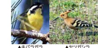
▲キバラガラ ▲ヤツガシラ