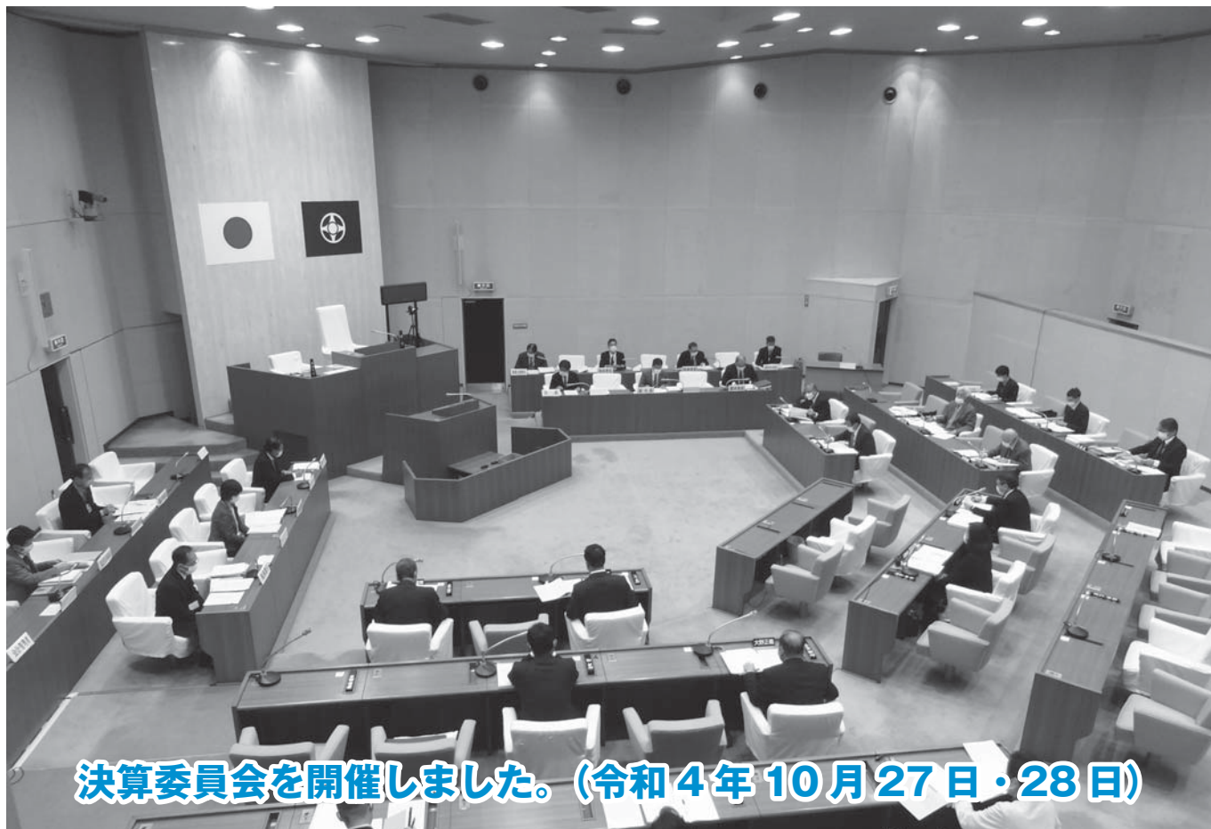
決算委員会を開催しました。(令和4年10月27日・28日)