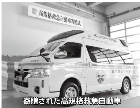
寄贈された高規格救急自動車

答 現在銚子市で保有している救急車は4台で、本署に2台、海上分遣所に1台、西部分遣所に1台配置しています。今回入れ替える車両は平成15年の配置で、本年2月時点での走行距離は24万6千428キロメートルです。