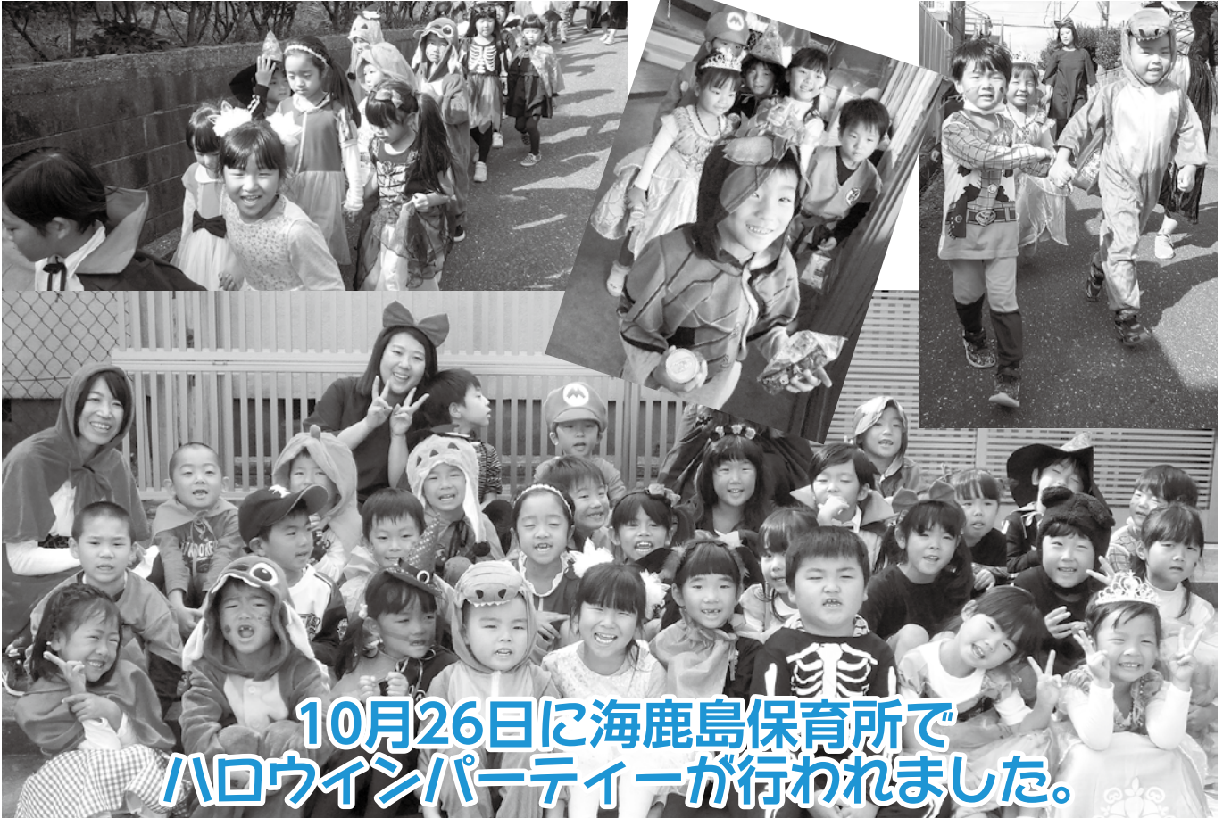
10月26日に海鹿島保育所でハロウィンパーティーが行われました。

銚子市議会ホームページ http://www.city.choshi.chiba.jp/gikai/