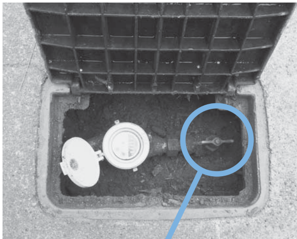
止水栓が開いている状態