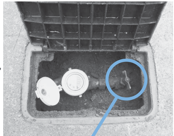
止水栓が閉まっている状態