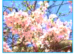
3/28 文化会館協の報です♪

平成30年3月11日(日)(於:文化会館中ホール) 歴史文化基本構想文化財講演会を開催しました!!