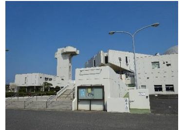
会場は青少年文化会館中ホール