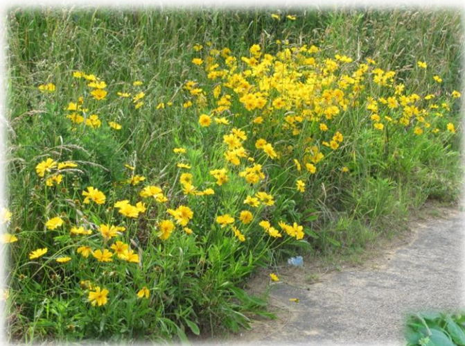
【オオキンケイギク】