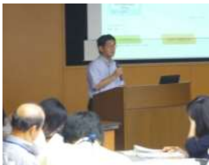
▲越川市長からあいさつと方針説明