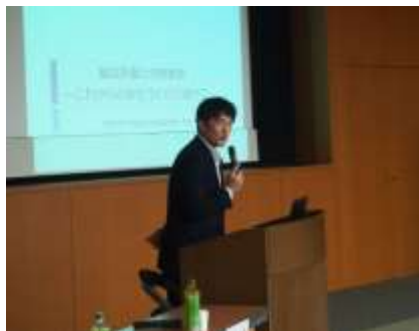
▲関谷教授による講演