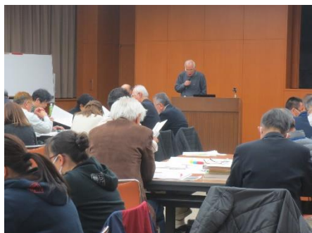
▲栄町防災委員会の講演（地区防災計画の説明）