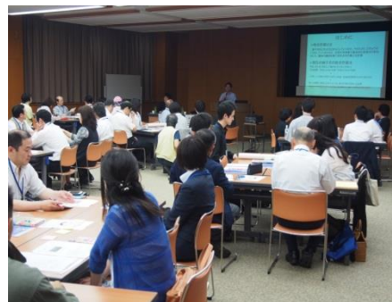
▲銚子市危機管理室の講演