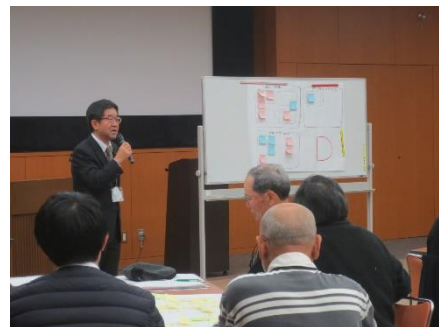
▲越川市長からワークショップの講評