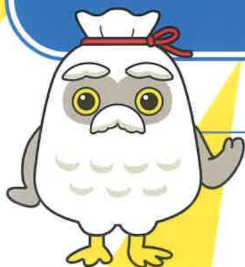
シルバー人材センター新 mascot 「チエブクロー」

銚子市在住の60歳以上、健康で働く意欲のある方なら、どなたでもご入会いただけます！本業をお持ちの方も、「副業」感覚で仕事をすることができます。