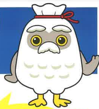
シルバー人材センター新マスコット 「チエブクロー」