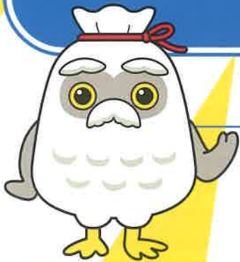
シルバー人材センター新 mascot 「チエブクロー」