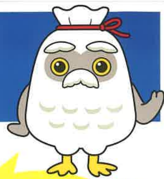
シルバー人材センター新 mascot 「チエブクロー」