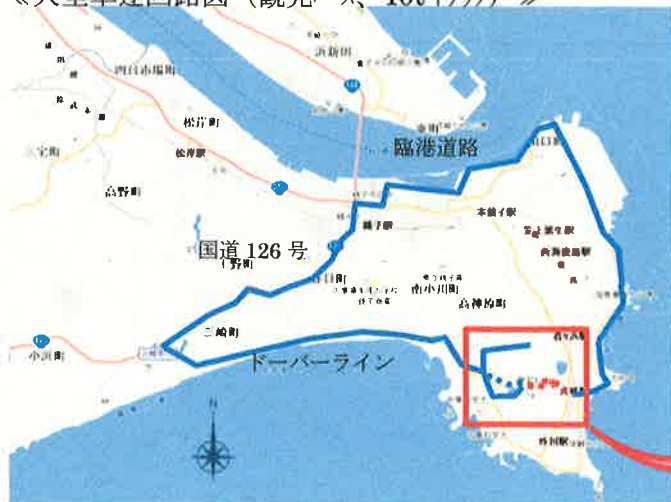
《大型車迂回路図 (観光バス、10tトラック)》