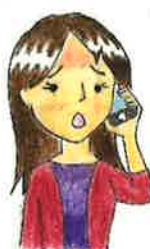
医療機関へ事前連絡