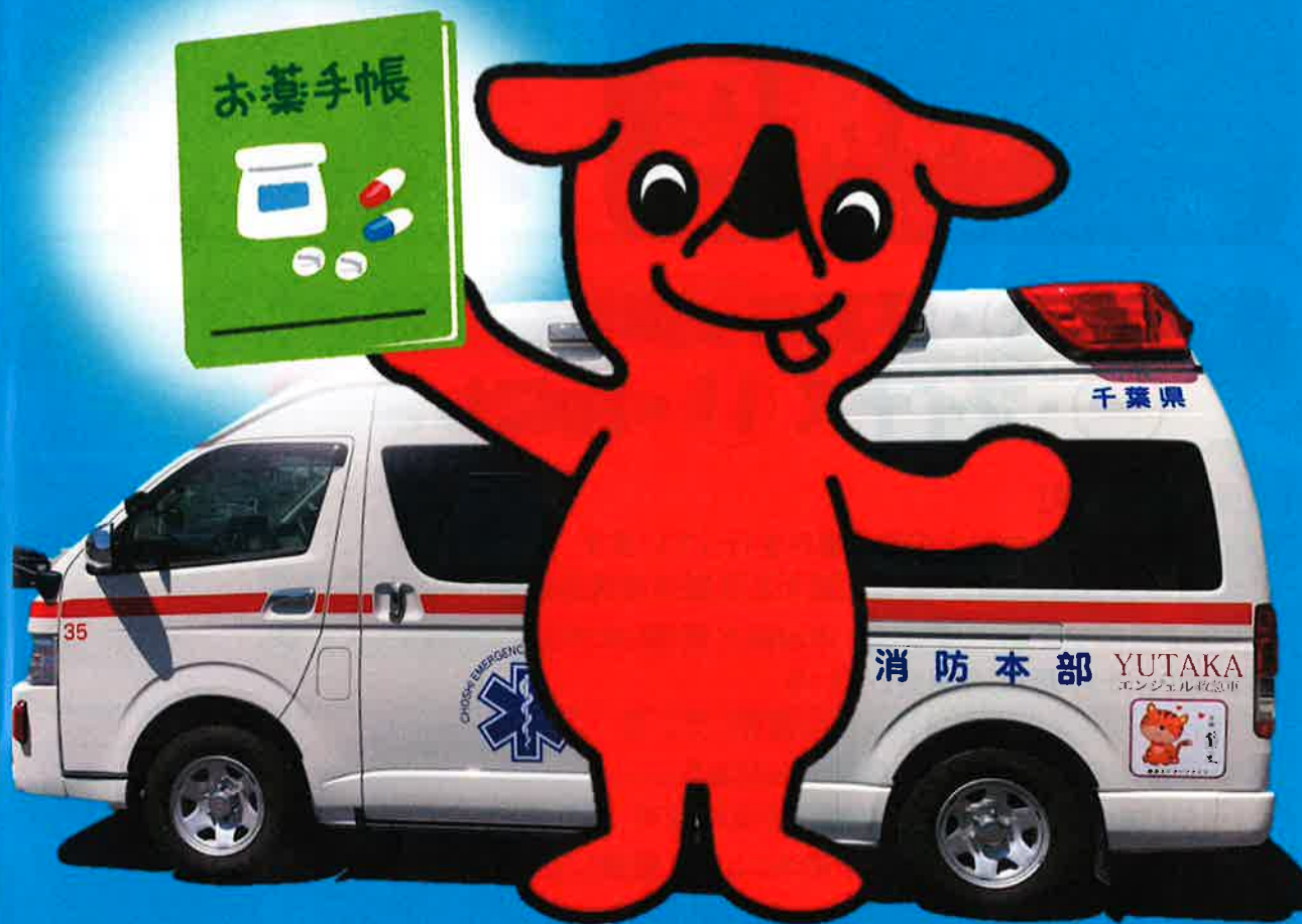
千葉県マスコットキャラクター「チーバくん」