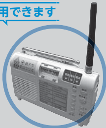
▲デジタル防災ラジオ