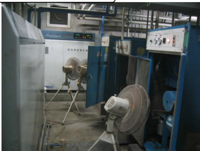
機器運転用コンプレッサー