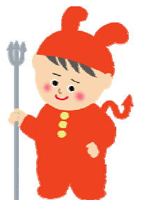
マスコットキャラクター らくがきくん