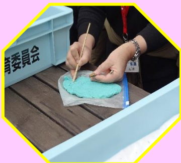
土器の文様の付け方！